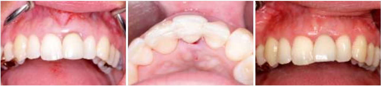
Abb. 10: Ausgangssituation mit verfärbtem Kronenrand und hyperplastischer Gingiva an Zahn 21. – Abb. 11: Provisorische Versorgung mit einem Ovate-Pontic ausgeformten Prothesenzahn mit Glasfaserverstärkung. – Abb. 12: Prothetische Versorgung mit Vollkeramikkrone drei Monate postoperativ.

zu erwartende Behandlungsergebnis. Somit werden die Vorstellungen und Wünsche zum einen aus prothetischer Sicht und zum anderen unter Berücksichtigung des idealen chirurgischen Vorgehens umgesetzt. Zunächst wird die Suprakonstruktion in Form einer Scanprothese hergestellt. Aufgrund dessen legt der Behandler dann in der 3-D-Planung die zukünftige Implantatposition fest. Des Weiteren sind mit computergestützter Navigation auch Augmentationsverfahren, wie Sinuslift, Knochenblocktransfer und Distractionen, genau zu planen. Sowohl die Position als auch das Volumen des Augmentates sind im dreidimensionalen Bild exakt zu ermitteln. Diese Planung hat auch den Vorteil, dass minimalinvasiv und wirtschaftlich gearbeitet wird, das heißt, es wird wirklich nur so wenig wie möglich aber so viel wie nötig Gewebe behandelt. Einheilzeiten von Implantaten können durch das beschriebene Vorgehen deutlich verkürzt werden.