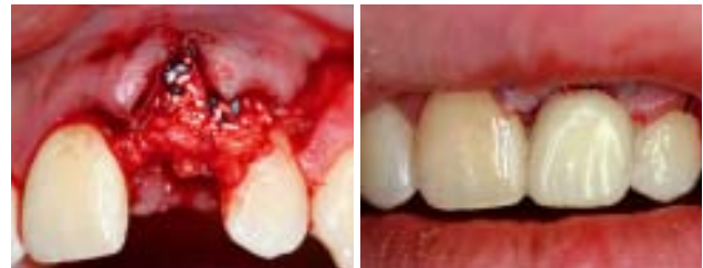
Abb. 7 und 8: Region 021 ist mit einem autologen Knochenblock augmentiert. Dieser ist mit Medicon Minischrauben fixiert. FRIOS® Algipore® ist als Resorptionsschutz aufgelagert. Die Abdeckung erfolgt mit einer Resodent®-Membran und abschließender krestaler Auflagerung von einem connective tissue graft vom Gaumen rechts. Eine neue provisorische Adhäsivbrücke (konfektionierter Prothesenzahn) mit Glasfaserbandverstärkung in situ.

Der Langzeiterfolg von Implantaten hat heutzutage viele Gesichter. Aufgrund der Erfahrung aus klinischen Studien der letzten Jahre haben sich drei wichtige Faktoren etabliert: die korrekte Implantatposition, das Gewebemanagement und Prognosefaktoren, wie das orale Keimspektrum des Patienten.