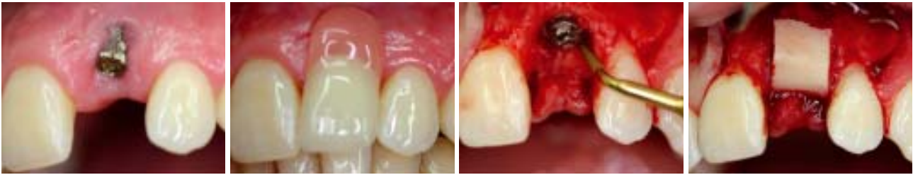
Abb. 4a und b: Weit nach vestibulär orientiertes Implantat und Versorgung mit Klammerprothese rechts. – Abb. 5 und 6: Atraumatische Explantation mittels Piezosurgery. Knochenblockaugmentat mit Entnahmestelle aus dem Kieferwinkel.

tratzennähten zwischen den einzelnen Procera® Kappen. Nach der Nahtentfernung kann zusätzlich mit interner Gingivektomie entstandenen Schmutznischen entgegengewirkt werden. Außerdem wird somit die Entstehung eines periimplantären Saumepithels stabil.