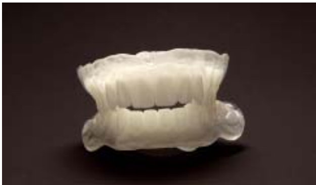
Abb. 1: Scanprothesen für Ober- und Unterkiefer eines zahnlosen Patienten mit Bariumsulfat in den prothetisch zu ersetzenden Regionen. Die Scanprothesen sind interokklusal exakt 2 mm gesperrt, um diese Distanz im Artikulator reproduzieren zu können.

■ Unter der Vorstellung, dass besonders am zahnlosen Kiefer die richtige Implantatposition schwierig zu bestimmen ist, reicht es nicht mehr aus, sich nur nach dem vorhandenen Knochenangebot zu orientieren. Vielmehr ist es wichtig, zuerst zu wissen, in welcher exakten dreidimensionalen Position der spätere Zahnersatz stehen soll. Dann erst wird mit der ExpertEase Software, der dreidimensionalen Computernavigation von DENTSPLY Friadent, geplant und millimetergenau die zukünftige Implantatposition bestimmt. Somit ist zu einem der gleichmäßig abgestützten Zahnersatz als auch ein ideales ästhetisches Ergebnis vorhersagbar. Die beiden weiteren Faktoren für den Langzeiterfolg von Implantaten sind das Hart- und das Weichgewebsmanagement. Wir wissen aus retrospektiven Studien, dass ein präimplantologischer Hart- und Weichgewebsaufbau nicht nur die natürlichsten Ergebnisse in der Implantologie liefert, sondern auch unabdingbar für ein langzeitstabiles Resultat ist.